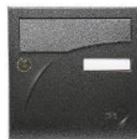
RAL 9005 Noir décor